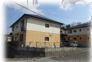
笠岡市大井南付近